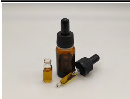
Foto del campione

LOD (Limit of Detection)**: 0,002% LOQ (Limit of Quantification)**: 0,005% **Per tutti i cannabinoidi